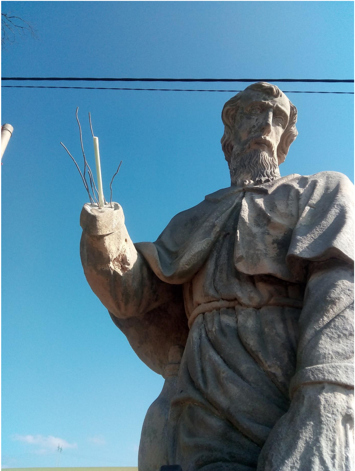
RADKOV – SV. ROCH příprava na doplnění ruky