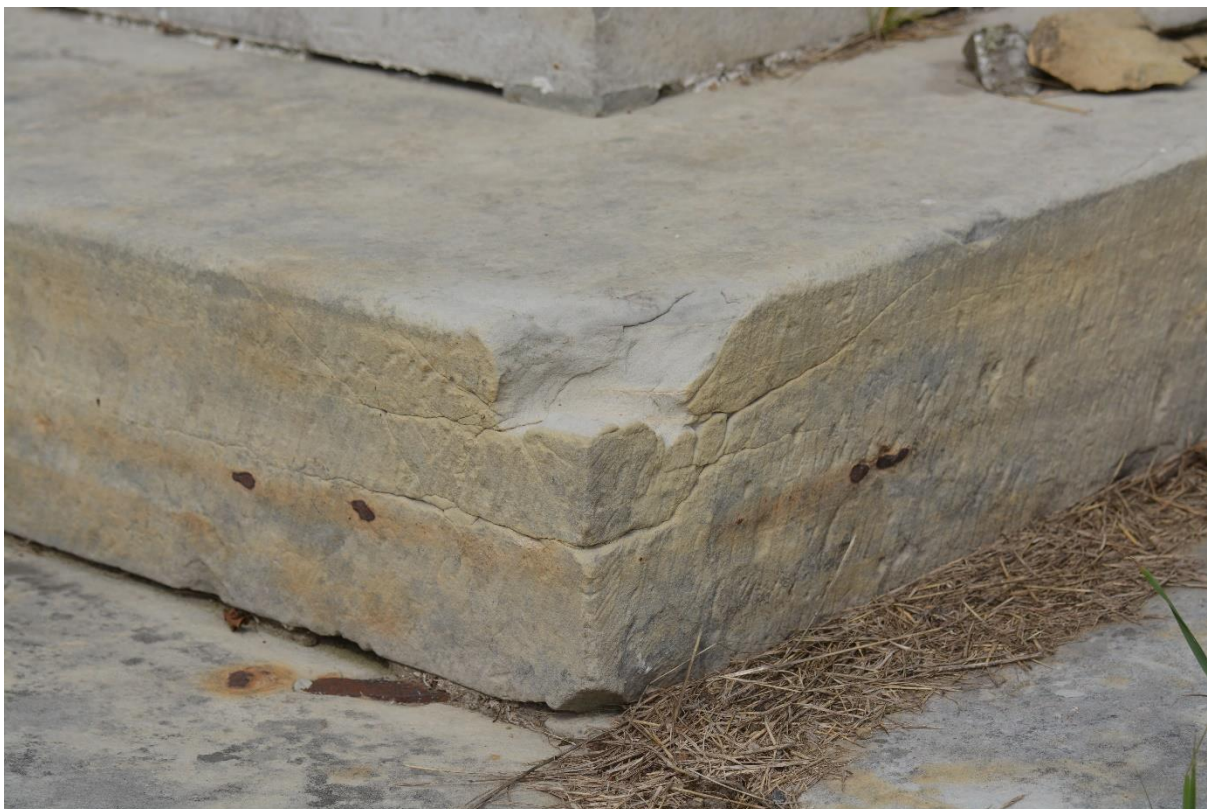
RADKOV – SV. ROCH stav po očištění