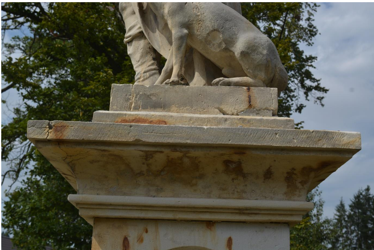
RADKOV – SV. ROCH stav po očištění