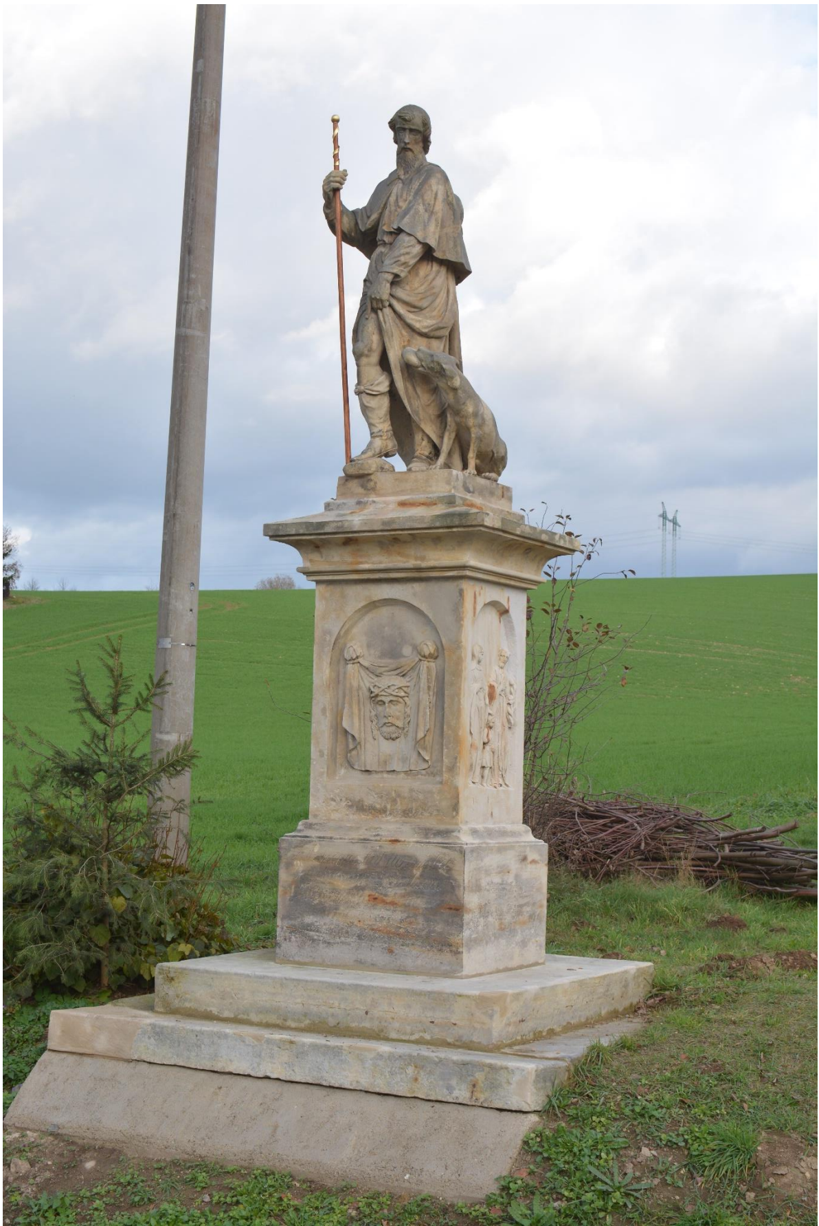
RADKOV – SV. ROCH Konečný stav po restaurování, osazení poutnické hole