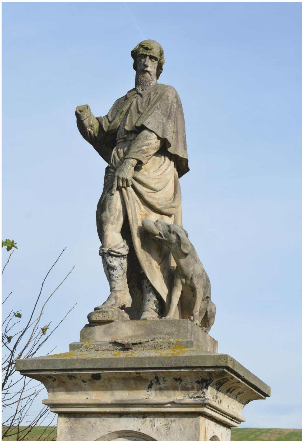
RADKOV – SV. ROCH stav před opravou v roce 2018