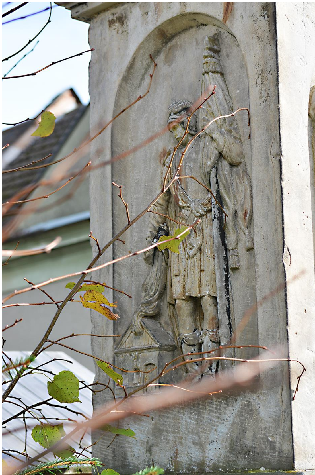
RADKOV – SV. ROCH stav před opravou v roce 2018