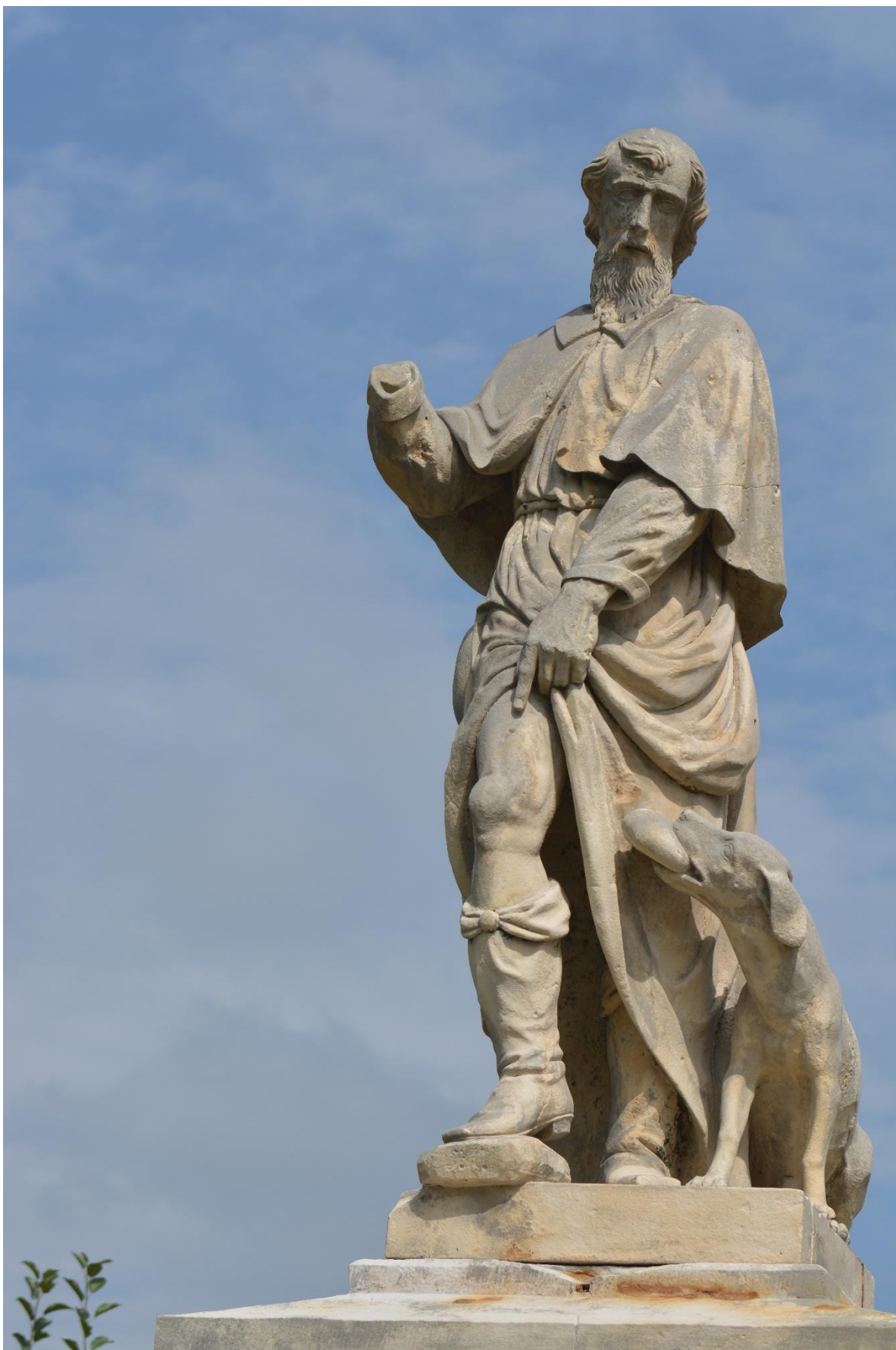
RADKOV – SV. ROCH stav po očištění