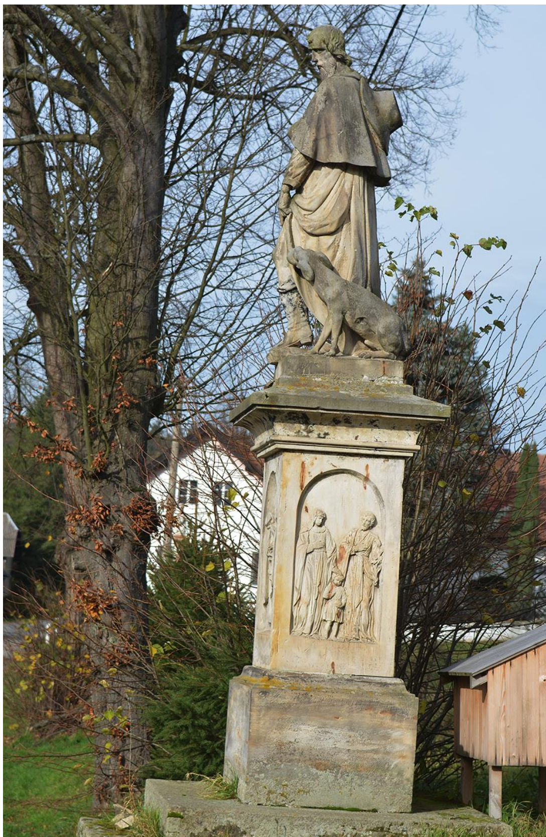
RADKOV – SV. ROCH stav před opravou v roce 2018