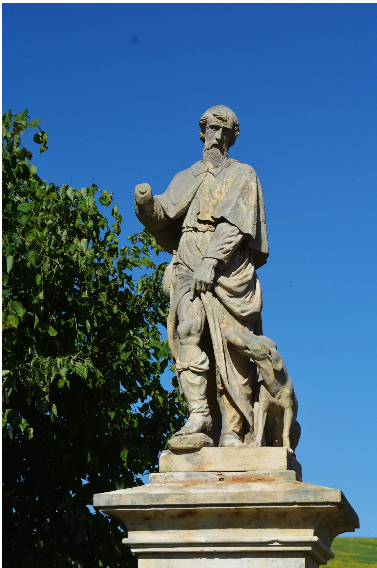
RADKOV – SV. ROCH stav po očištění