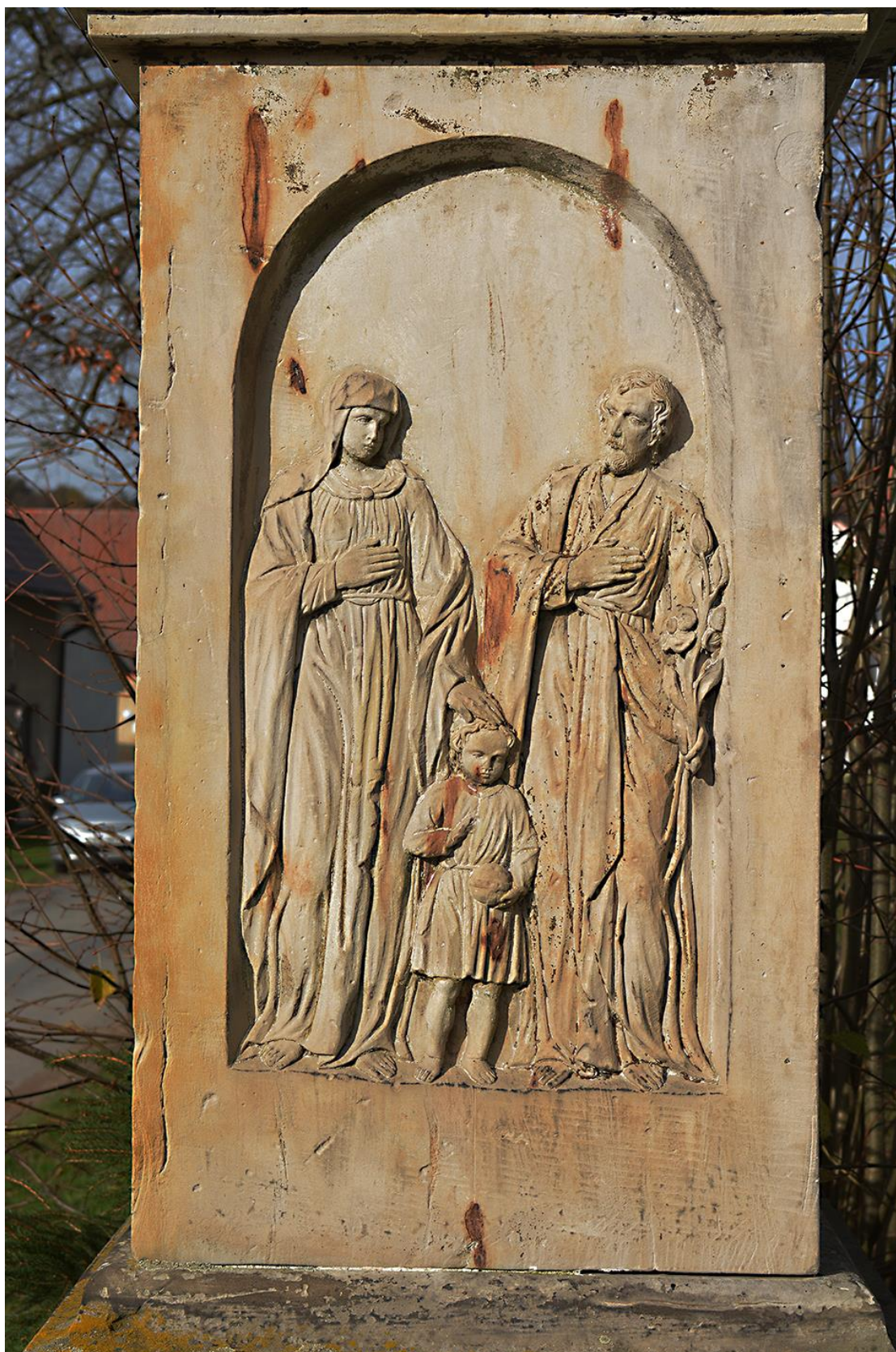
RADKOV – SV. ROCH stav před opravou v roce 2018