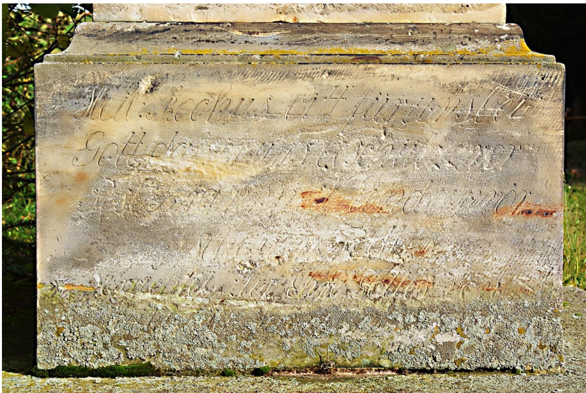
RADKOV – SV. ROCH stav před opravou v roce 2018