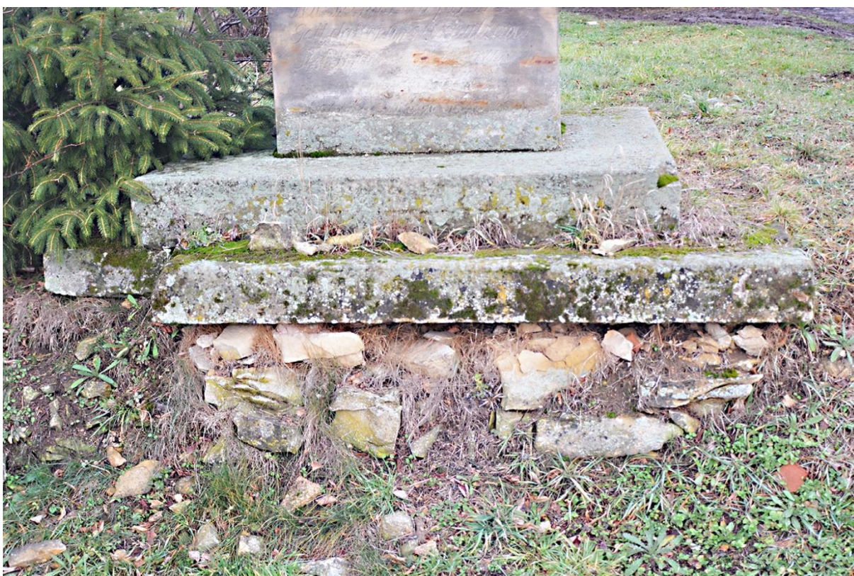
RADKOV – SV. ROCH stav před opravou v roce 2018