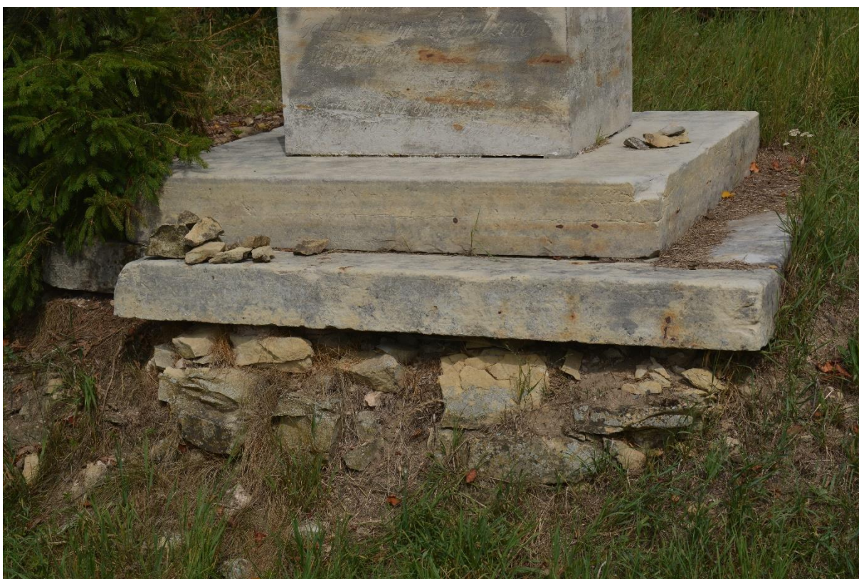
RADKOV – SV. ROCH stav po očištění