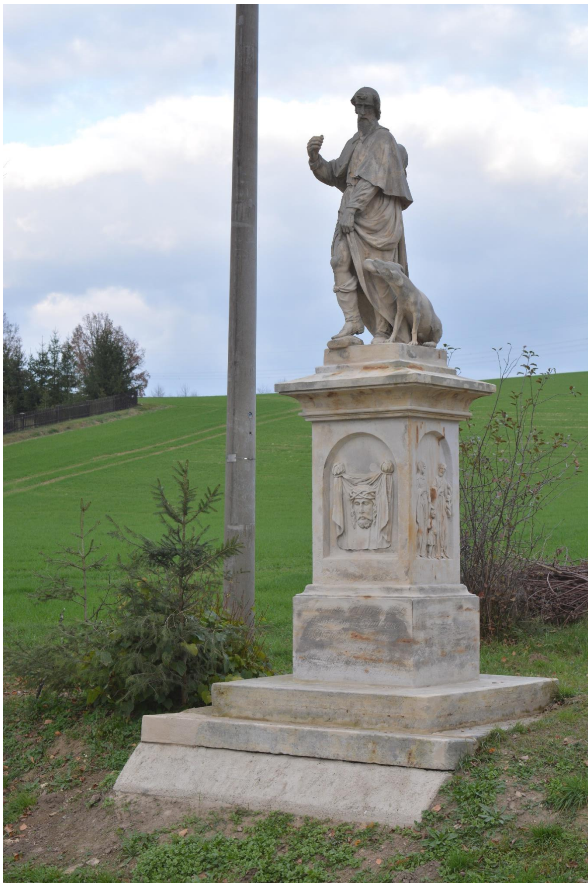
RADKOV – SV. ROCH stav po srovnání základu, statickém zajištění, tmelení defektů a doplnění ruky