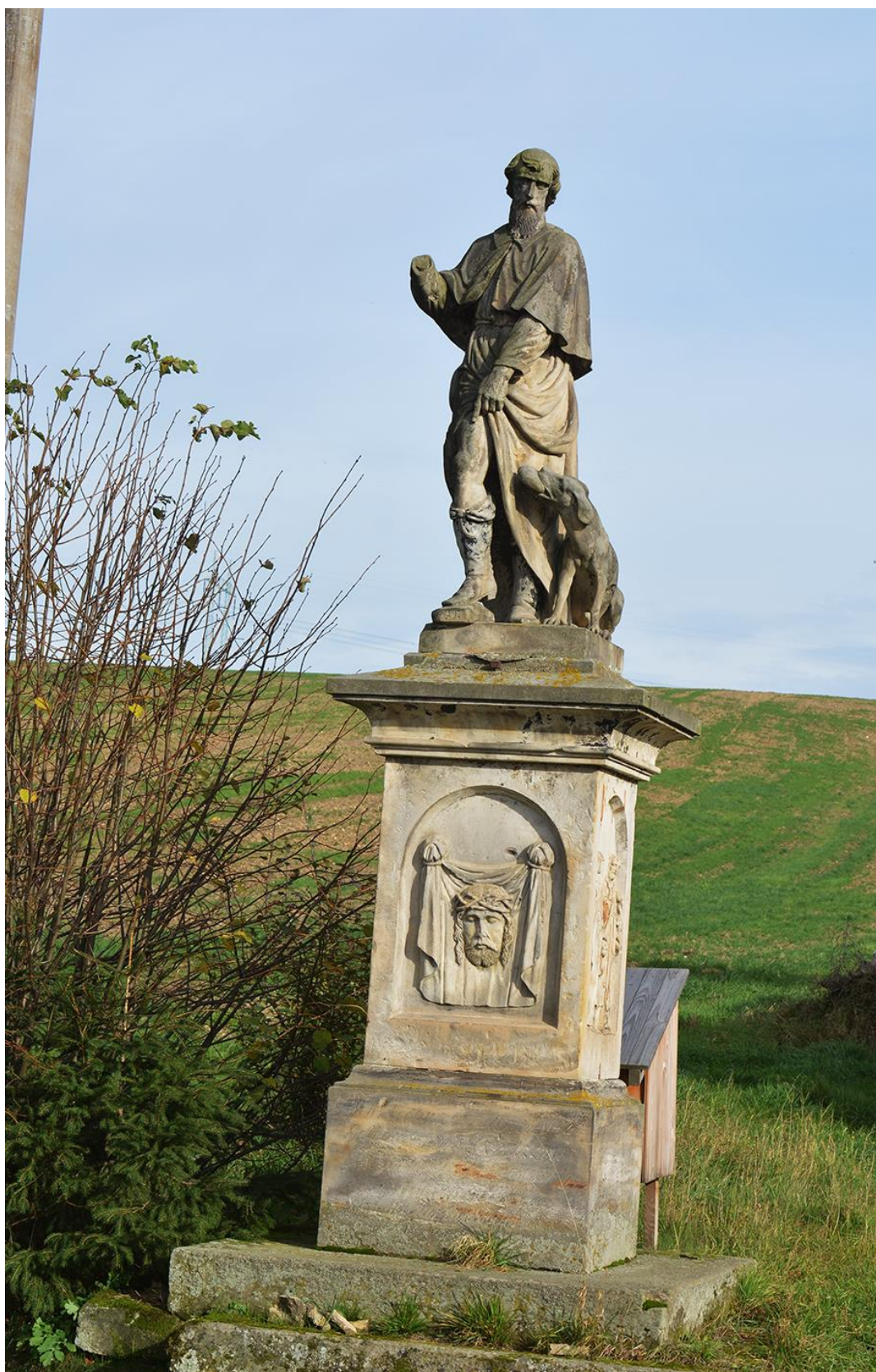
RADKOV – SV. ROCH stav před opravou v roce 2018