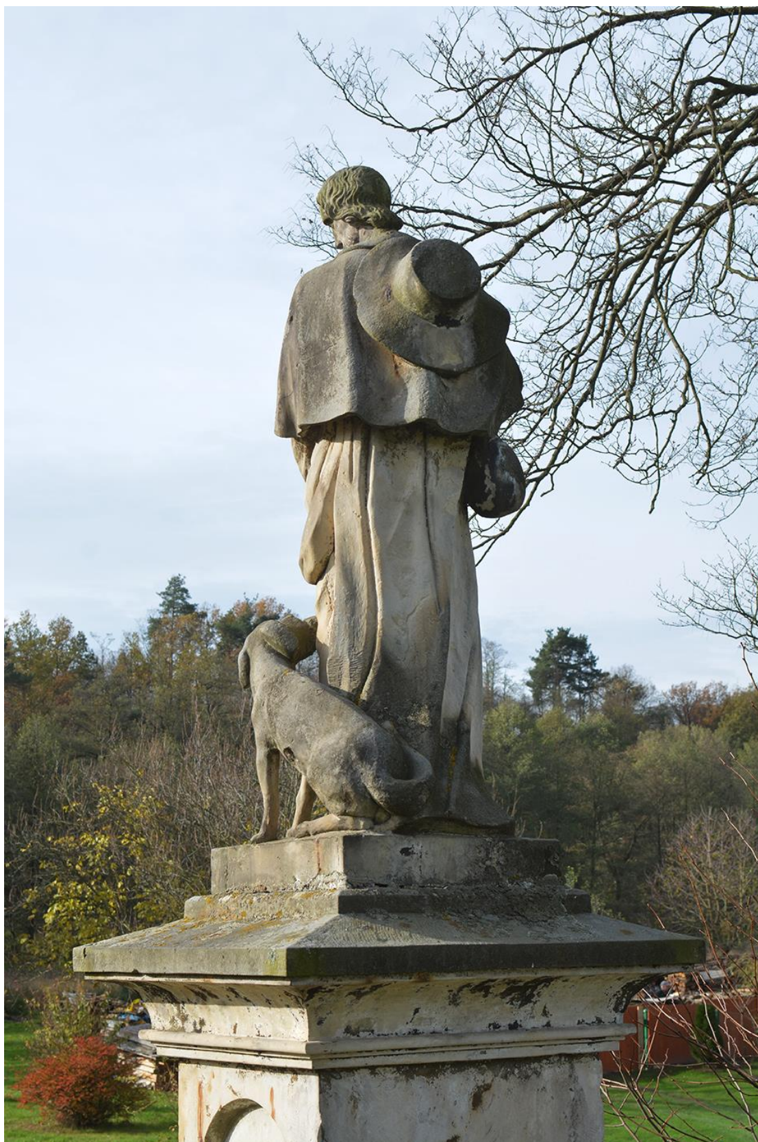
RADKOV – SV. ROCH stav před opravou v roce 2018