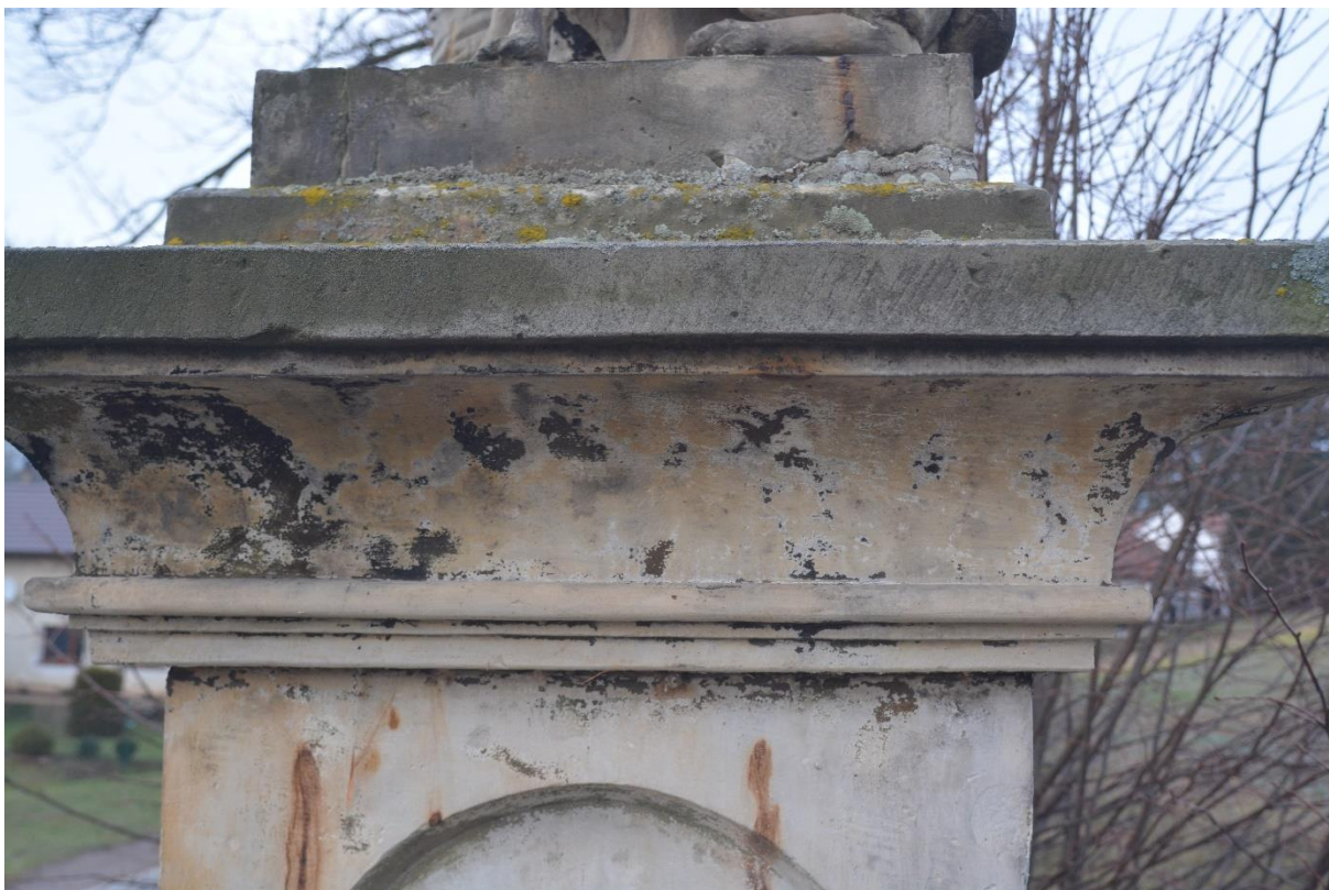
RADKOV – SV. ROCH stav před opravou v roce 2018