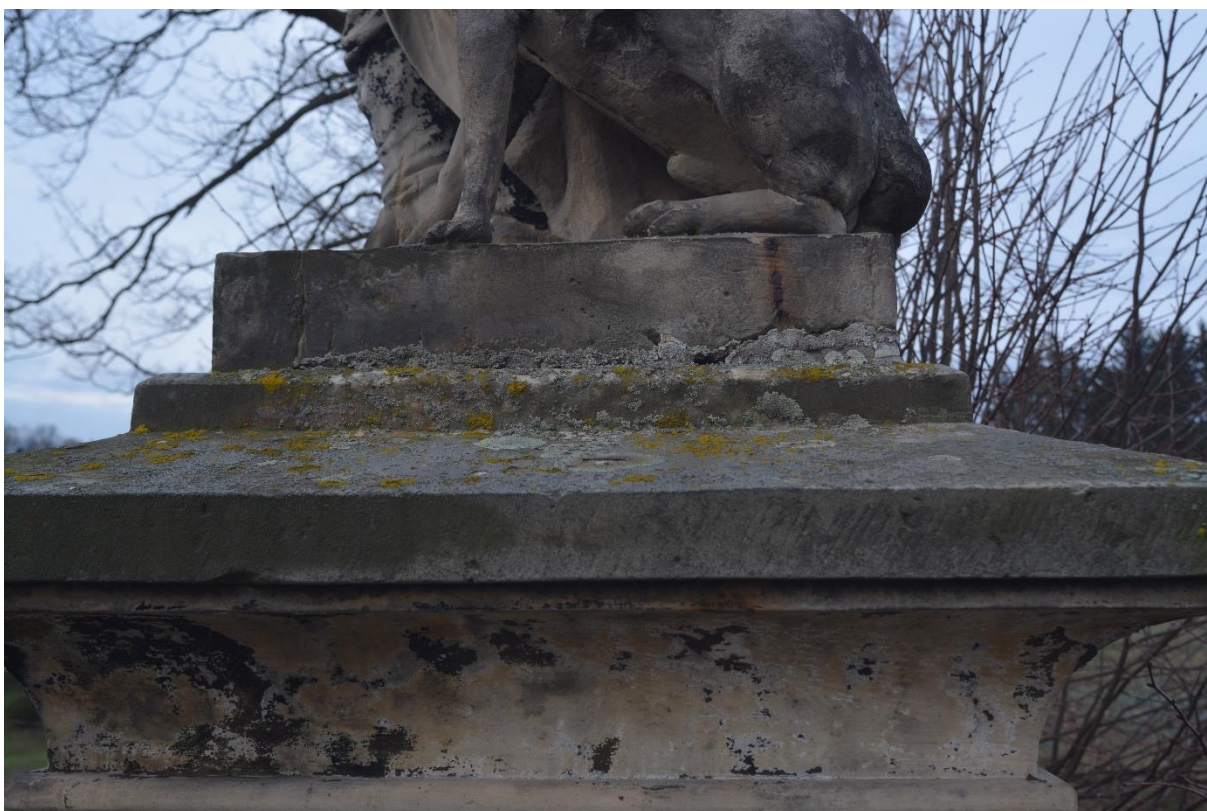
RADKOV – SV. ROCH stav před opravou v roce 2018