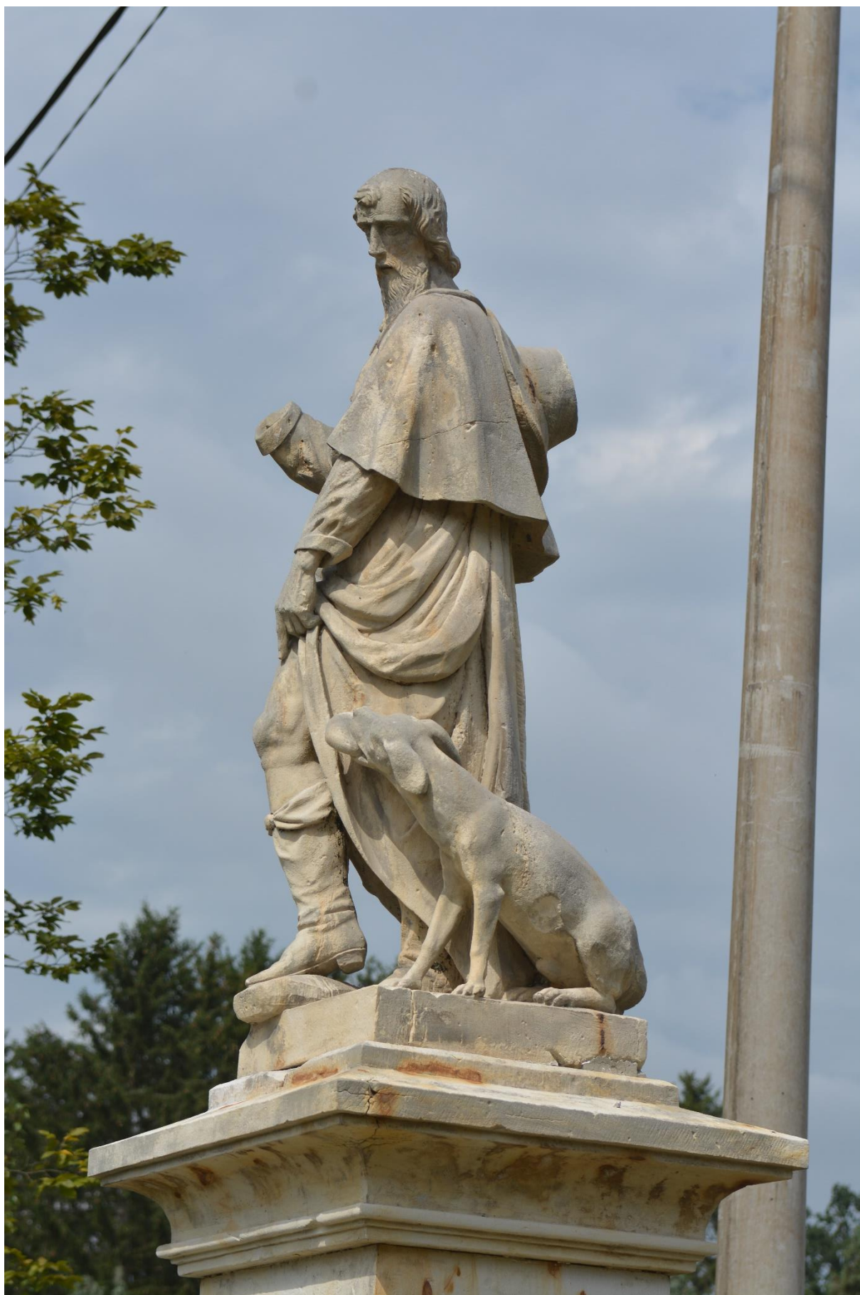
RADKOV – SV. ROCH stav po očištění