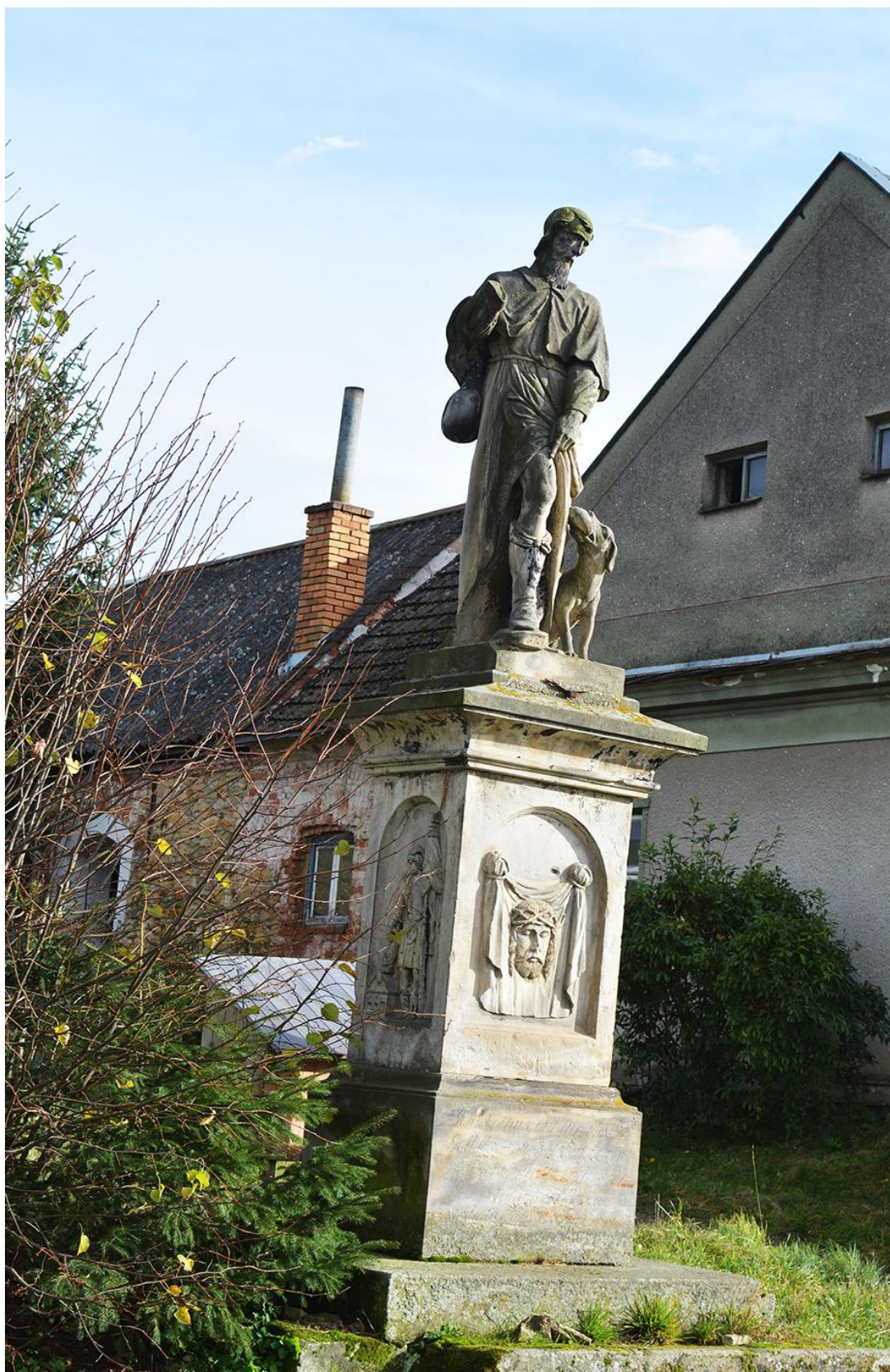
RADKOV – SV. ROCH stav před opravou v roce 2018