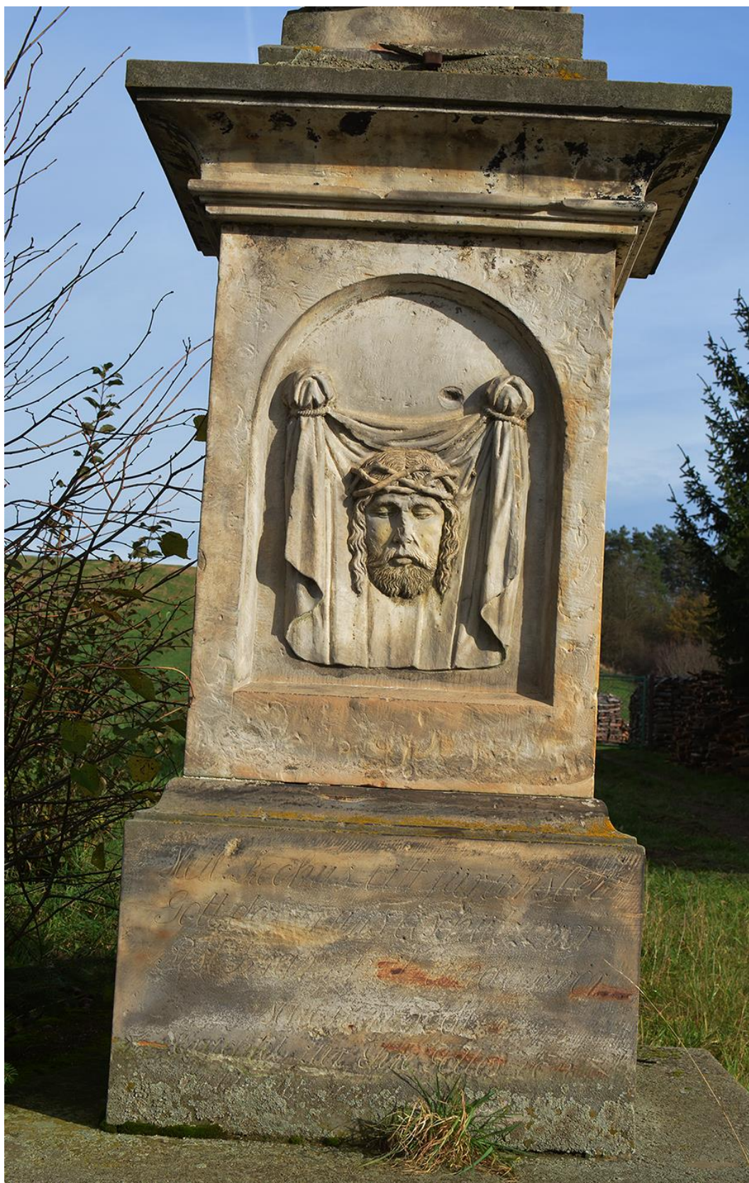
RADKOV – SV. ROCH stav před opravou v roce 2018