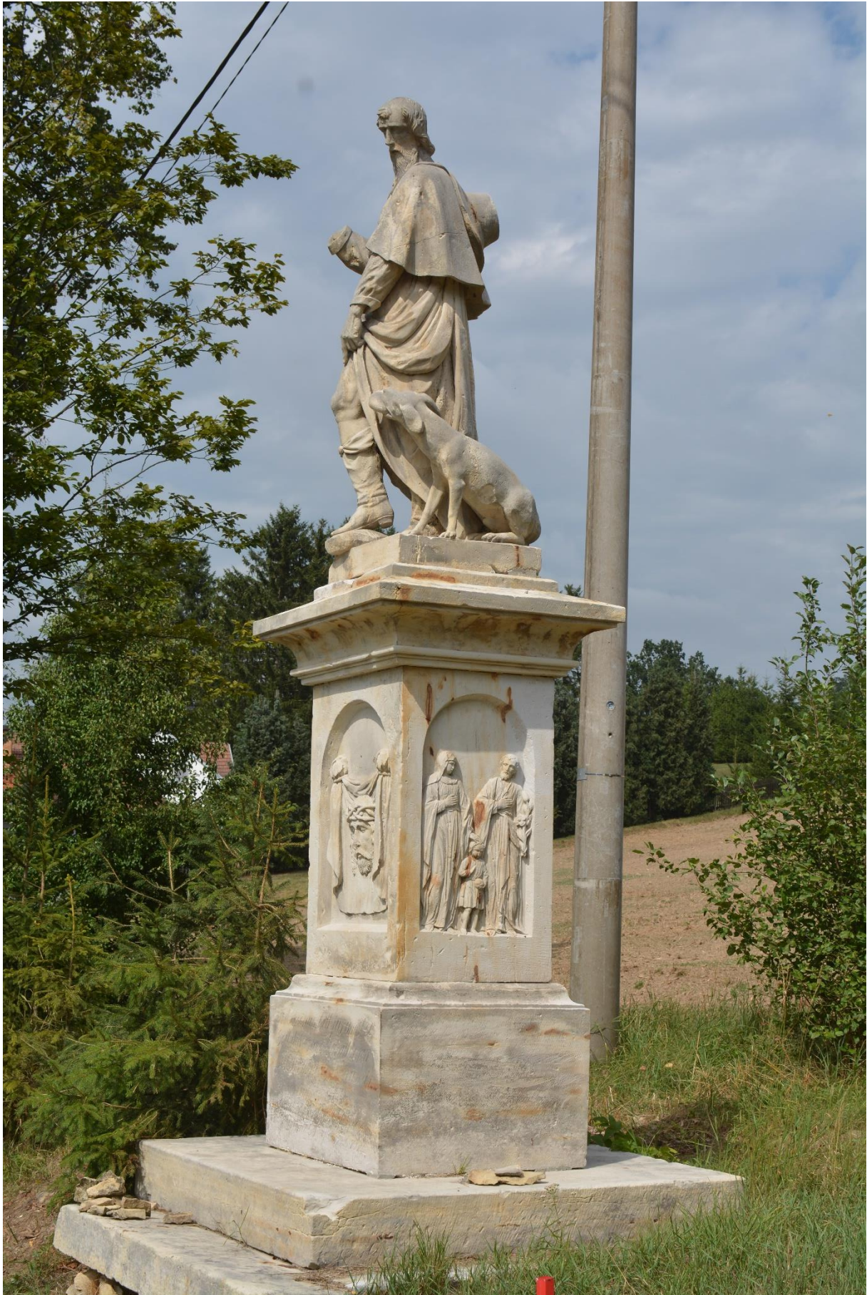
RADKOV – SV. ROCH stav po očištění