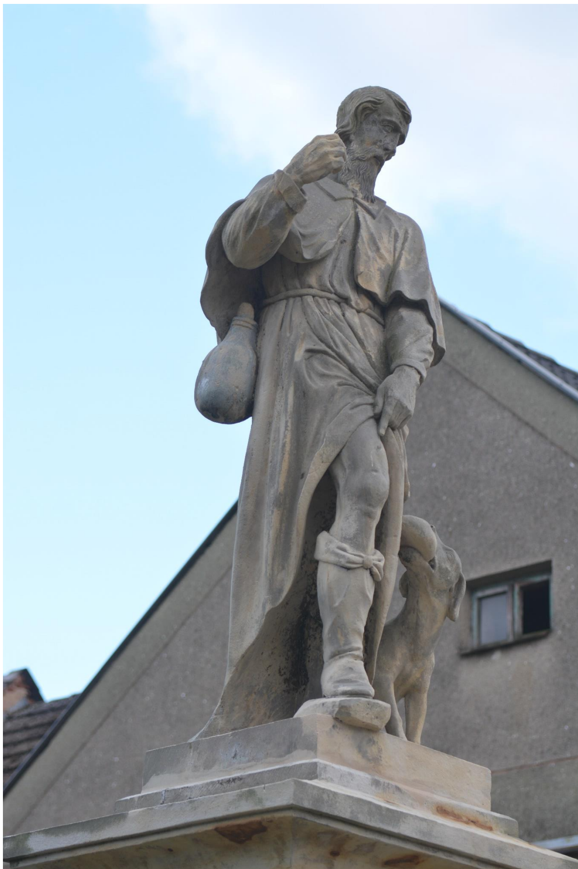
RADKOV – SV. ROCH stav po srovnání základu, statickém zajištění, tmelení defektů a doplnění ruky